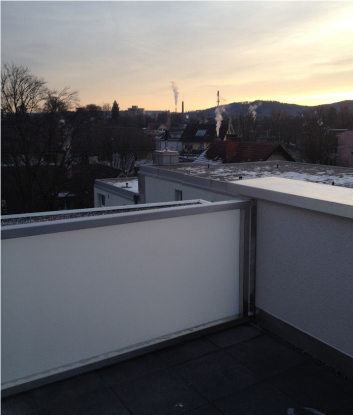
Dachterrasse mit Markise – Bild 7