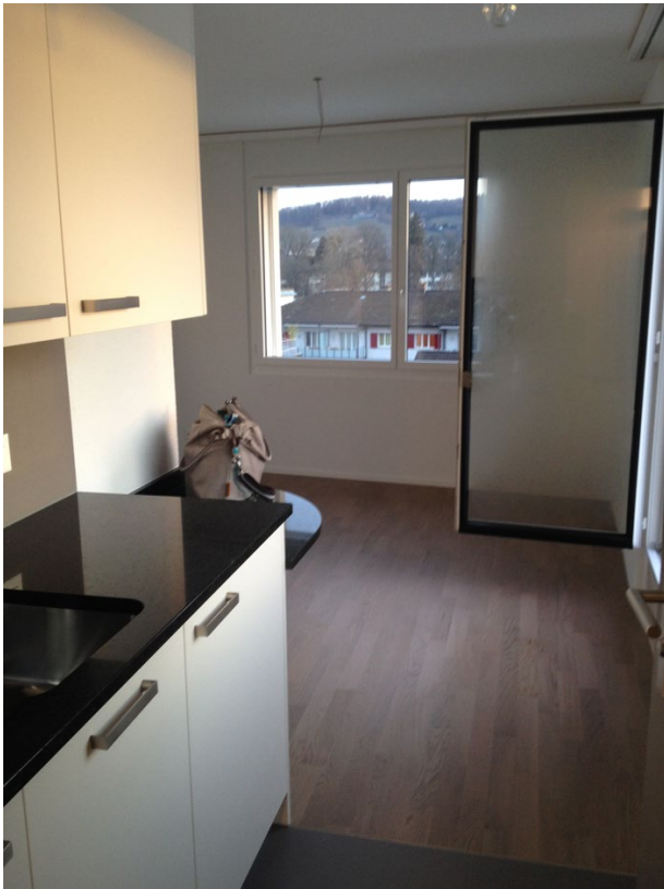
Wohnen und Küchenzeile – Zugang Dachterrasse – Bild 3