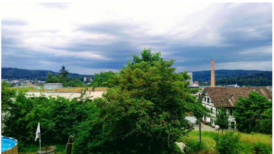
Terrasse mit Lounge (der Hund wohnt nicht im Haus ☺) mit Aussicht auf Winterthur.