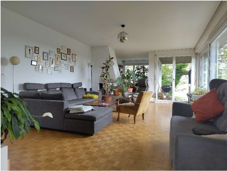
Wohnzimmer mit Cheminée (oben) und Esszimmer (unten).